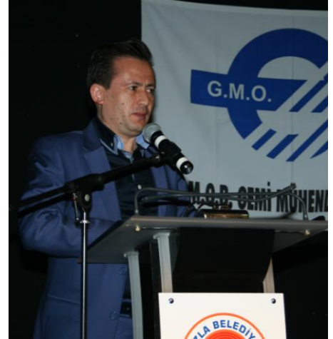
Tuzla Belediye Başkanı Şadi Yazıcı