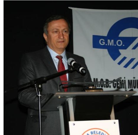
Gemi ve Yat İhracatçıları Başkanı Başaran Bayrak